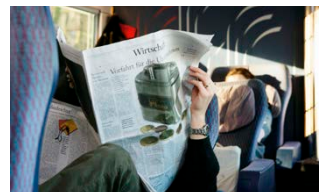
Abbildung 7: Ohne Störung bis ans Ziel.

zu achten. Mittels kurzer Sätze erleichtern Sie Ihren Lesern zudem das Verständnis.