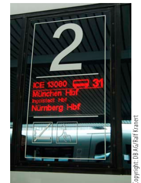
Abbildung 3: Einsteigen oder nicht? Dies beantwortet der Zuglaufanzeiger.