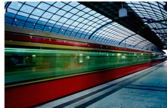
Abbildung 6: Wie Züge haben auch Texte eine optimale Länge.

So wie Fahrgäste eine ruhige Fahrt wünschen, so erwarten Leser eine gute sprachliche Aufbereitung. Wir bitten Sie daher auf die Rechtschreibung und klare, eindeutige Wortwahl