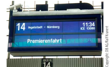
Abbildung 2: Der Fahrtrichtungsanzeiger klärt, wo die Reise hingehet.