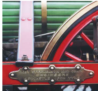
Abbildung 9: Typenschild des Herstellers.

Der Copyright-Vermerk nennt den Eigentümer der Bildrechte und unter Umständen auch den Urheber (Grafiker, Fotograf oder andere). In der „Mediathek der Deutschen Bahn“ finden Sie diese Angaben grundsätzlich in den Informationen zum Bild. Bei anderen Quellen müssen Sie den Copyright-Vermerk gegebenenfalls anfordern.